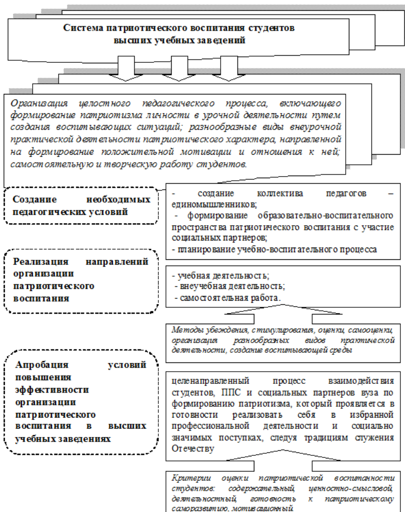
Рис. 1. Система патриотического воспитания студентов высших учебных заведений

репить свое здоровье, овладеть прикладными видами спорта.